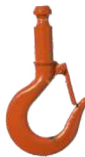
Abnehmbarer und austauschbarer Haken